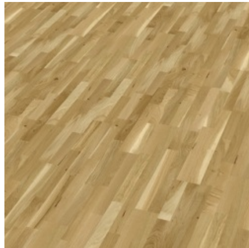
Dub country lak